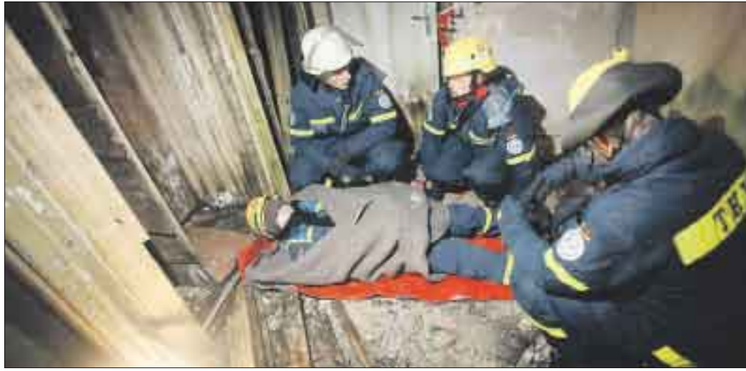
Unter schwersten Übungs-Bedingungen barg das THW die Verletzten.

● Wenn das Gesetz so verabschiedet wird, wie es im Entwurf steht, dann gibt es auch die Möglichkeit, durch Direktüberweisung an die Gemeinde, den Bildungsträger oder die Schule unbürokratisch vorzugehen. gro